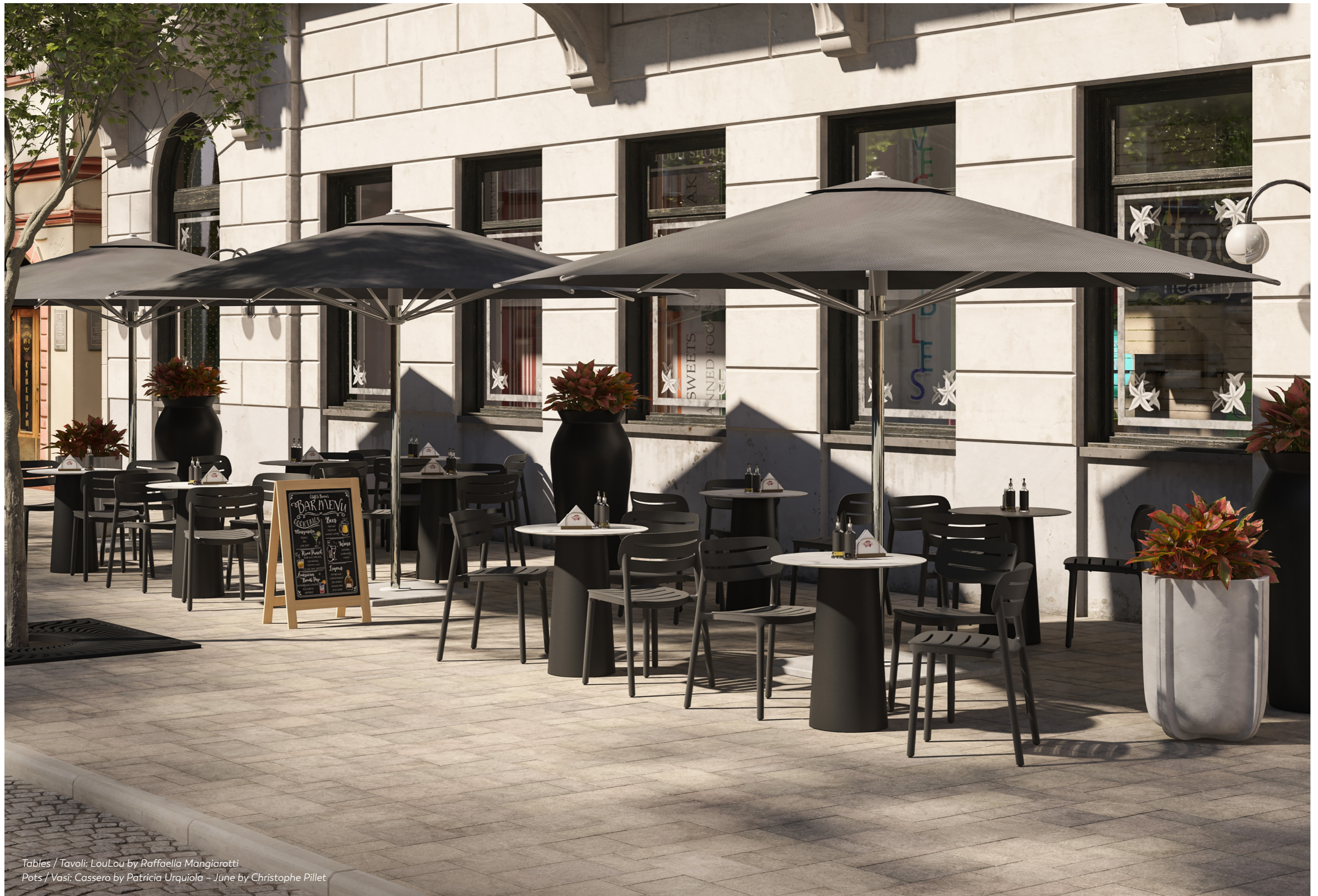
Tables / Tavoli: LouLou by Raffaella Mangiarotti Pots / Vasi: Cassero by Patricia Urquiola - June by Christophe Pillet